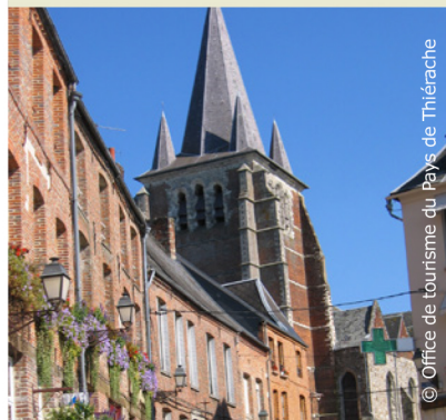
L'église fortifiée de Vervins