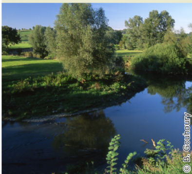
Paysage bocager de la vallée de l'Oise