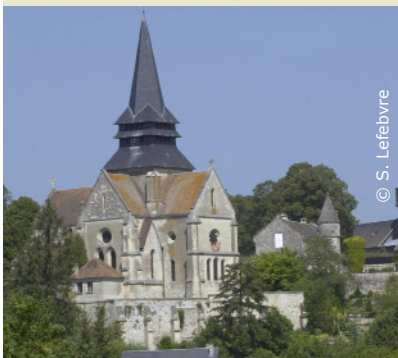
Eglise de Saint-Pierre-Aigle

Villers-Cotterêts (château, allée royale et musée Alexandre Dumas)