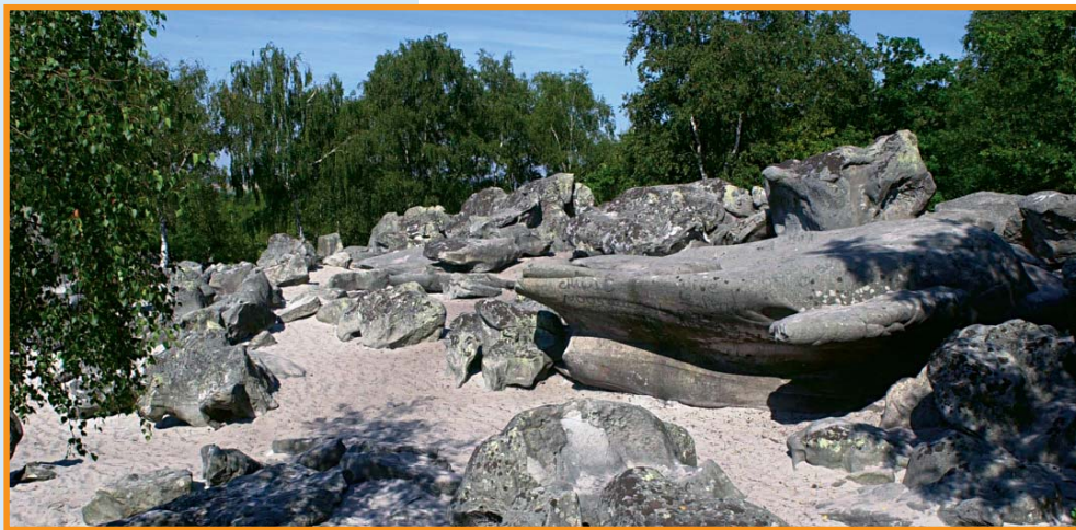
La Hottée du Diable. -S. Lefebvre-