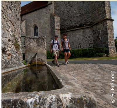
Lavoire à Vendières