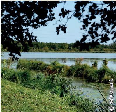
Etang de Bihécourt

INFOS TOURISTIQUES : Office de Tourisme du Pays du Vermandois T. 03 23 09 37 28