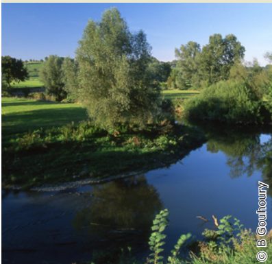
Paysage bocager de la vallée de l'Oise