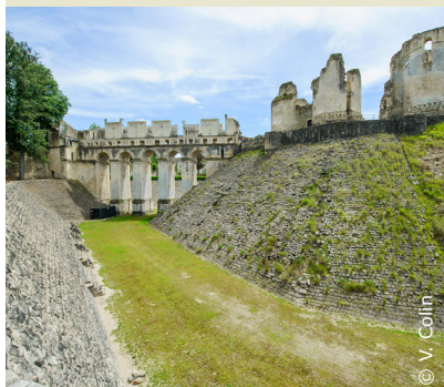
Au cœur du Tardenois, le château de Fère