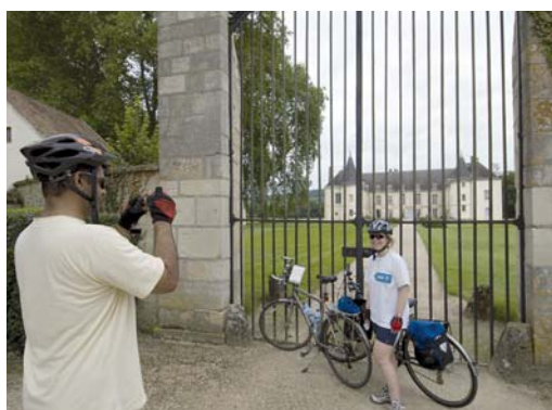
Le château de Condé-en-Brie.

Location de vélo : Sport Passion à Brasles, 03 23 69 45 97.