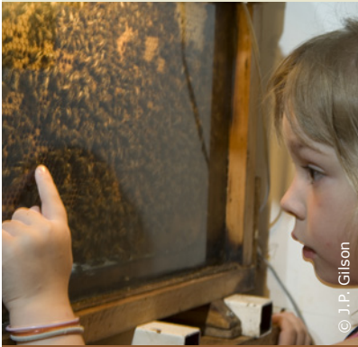
Les Ateliers de l'abeille