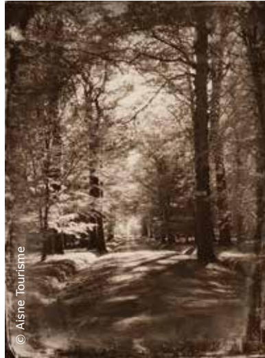
Promenade dans le Bois de Belleau