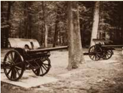
Les canons du Bois de Belleau