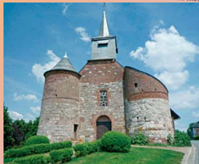
L'église fortifiée de Bancigny.