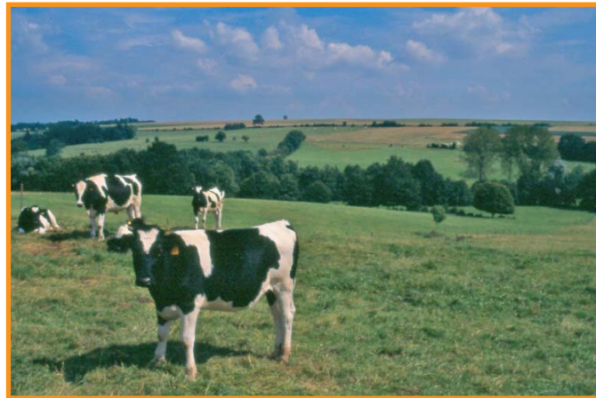
Vache typique de la Thiérache. -S. Lefebvre-

Cette balade facile explore les rues en pente douce de Vervins, capitale de la Thiérache, et varie les angles de vue sur les remparts. Au retour, découvrez l'histoire de Verbinum, un centre important à l'époque gallo-romaine, qui fut fortifié par Raoul de Coucy au XII e siècle. La ville conserve un riche patrimoine dont l'église, avec ses peintures sur piliers, constitue le fleuron.