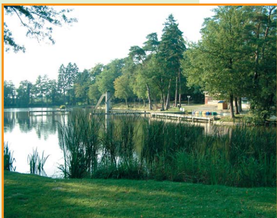
Lac de l'Astrée. -Office de Tourisme du Nouvion-en-Thiérache-

D Du parking en face de l'étang. Prendre le chemin qui se dirige vers le plan d'eau. 1 À l'embranchement, longer l'étang dans le sens inverse des aiguilles d'une montre. Franchir le petit pont. 2 Longer le camping et franchir un autre petit pont. 3 Prendre à gauche vers les bâtiments de la base de loisirs tout en longeant le plan d'eau. 4 Tourner à droite pour rejoindre le parking.