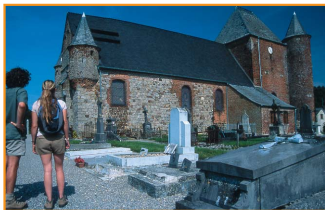
Église d'Englancourt. -Anne-Sophie Flament-

donjon carré au niveau du chevet avec ses deux tours percées de meurtrières. Observer d'ailleurs les différents niveaux et angles de tirs des meurtrières. Enfin, revenir au point de départ.