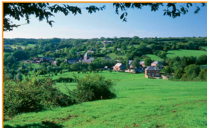
Le village de Lerzy. -B. Gouhoury-

Cette fiche est extraite du site www.randonner.fr