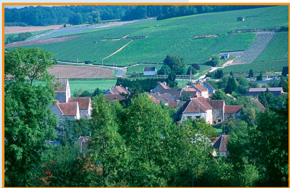
Les versants du Surlmelin à Baulne-en-Brie. -B. Gouhoury-