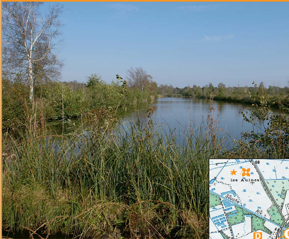
Étang dans le marais de Pierrepont.

min à droite. Après 50 m, tourner à gauche dans le chemin herbeux. 6 Au débouché sur la D 24, prendre à gauche pour rejoindre le point de départ.