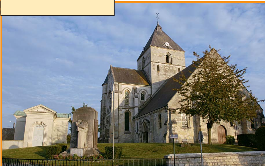
Église Saint-Pierre de Guignicourt. -S. Lefebvre-