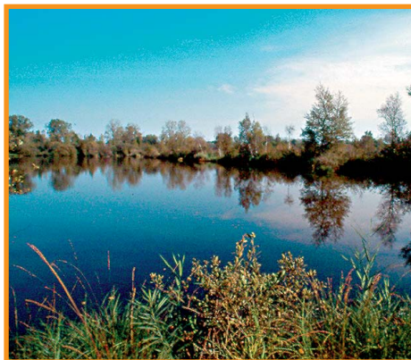
L'étang de la Souche. S. Lefebvre-

Cette balade très courte, idéale pour une sortie avec des enfants, évolue à travers les marais, le long des canaux et du ru de la Buze.