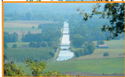
Canal depuis le 27 e BCA. -C. C. du Chemin des Dames-