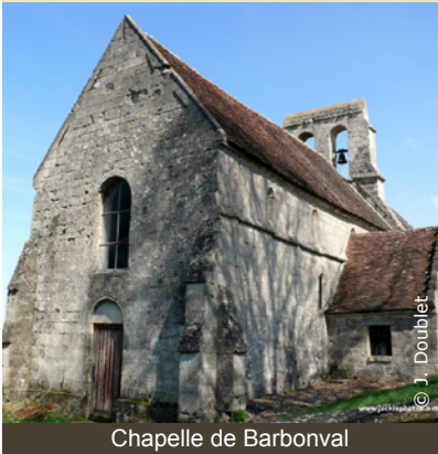
Chapelle de Barbonval