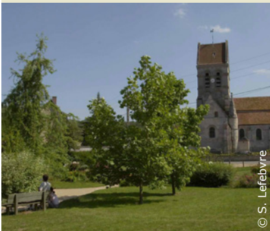
Village de Vauxrezis

INFOS TOURISTIQUES : Office de Tourisme du GrandSoissons Tél. 03 23 53 17 37