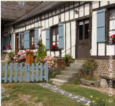
Jolie maison en chemin