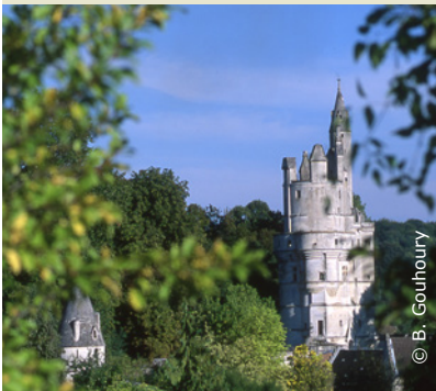
Le donjon de Septmonts