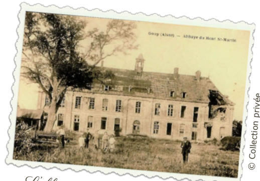
L'abbaye du Mont-Saint-Martin après guerre

En mars 1917, l'armée allemande effectue un retrait stratégique sur cette ligne, pour perturber l'offensive « Nivelle ». À la fin de la guerre, l'abbaye, malgré sa protection par une batterie de quatre canons, est en partie détruite. Seuls l'aile ouest et le colombier sont épargnés.