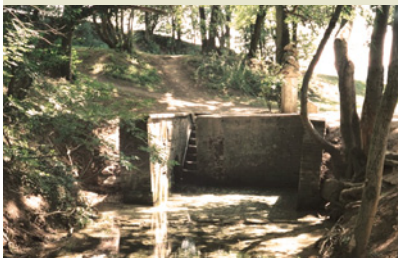
La source de l'Escaut