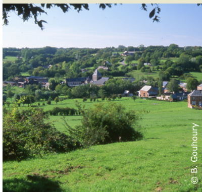
Le village de Lerzy