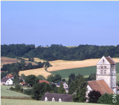
Vue sur Saconin-et-Breuil