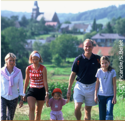
Balade à Caumont