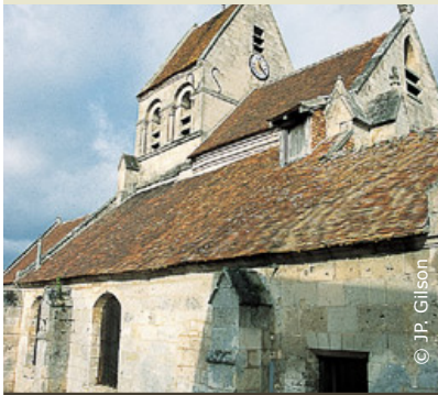
L'église de Pommiers