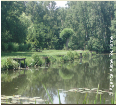
Le paradis des pêcheurs