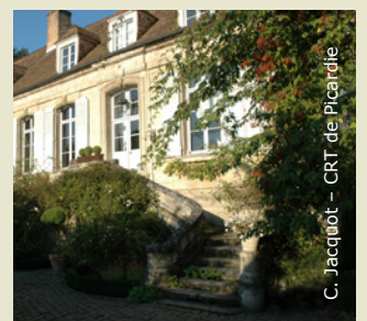
C. Jacquot - CRT de Picardie

À Bruyères-et-Montbérault, ce sont plus de 15 vendangeoirs qui enjolivent le bourg. À Vorges, il est toujours possible d'admirer le vendangeoir du XVIII e siècle (avec pressoir, portail et mur de clôture) situé au n° 1 de la rue du Docteur Ganault. Parmi la vingtaine de vendangeoirs que compte Presles-et-Thierry, la Grande Maison mérite le coup d'œil pour son élégance et son raffinement. Un détour par Orgeval révèle un vendangeoir de 1775 dont on peut admirer façades et toitures (photo) : il conserve encore cave et cellier, les communs avec écurie, et dispose d'un jardin à l'italienne composé de trois terrasses compartimentées par des haies de buis et de rosiers. Enfin, à Bourguignon, le vendangeoir du XVIII e siècle est précédé d'un beau parc jardiné. Ces habitations d'exception sont parfois reconverties en chambres d'hôtes : une bonne occasion de découvrir de l'intérieur, le charme discret de ces villégiatures de caractère.