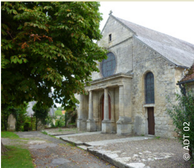
Le parvis de l'église Sainte-Clotilde