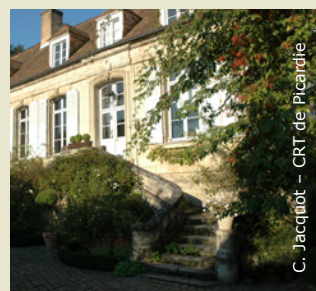
C. Jacquot - CRT de Picardie

La région recèle de nombreux souvenirs de son passé viticole. Outre les vendangeoirs de Nouvion-le-Vieux, on peut ainsi admirer celui du 17 e siècle (avec pressoir, portail et mur de clôture) situé à Vorges au n° 1 de la rue du Docteur Ganault (photo). Parmi la vingtaine de vendangeoirs que compte Presles-et-Thiemy, la grande maison mérite le coup d'oeil pour son élégance et son raffinement. Un détour par Orgeval révèle un vendangeoir de 1775 dont on peut admirer façades et toitures : il conserve encore cave et cellier, les communs avec écurie, et dispose d'un jardin à l'italienne composé de trois terrasses compartimentées par des haies de buis et de rosiers. Enfin, à Bourguignon, le vendangeoir du 18 e siècle est précédé d'un beau parc jardiné. Ces habitations d'exception sont parfois reconverties en chambres d'hôtes : une bonne occasion de découvrir de l'intérieur le charme discret de ces villégiatures de caractère.