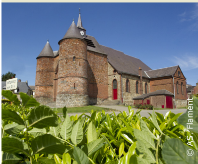
L'église fortifiée de Wimys