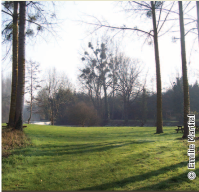
L'aire de pic-nic aux abords de la rayère