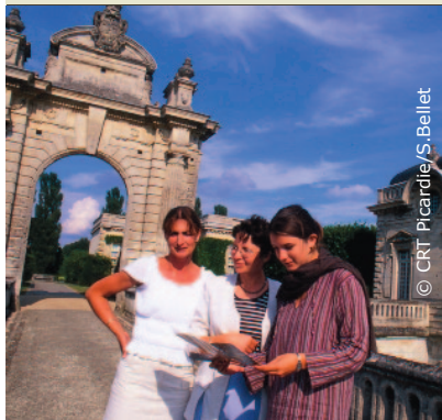
Château de Blérancourt