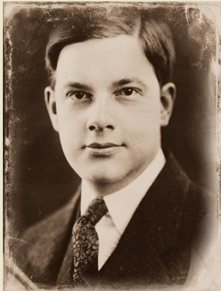
Joyce Kilmer, poète et soldat américain, tué pendant la 2 de Bataille de la Marne