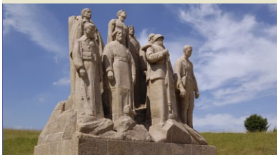
Monument des Fantômes