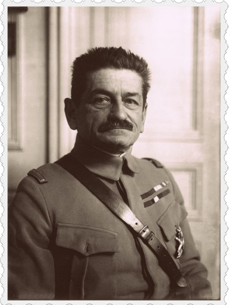
Portrait du Général Mangin, aux commandes de l'offensive de juillet 1918

Le 18 juillet, sous le commandement des généraux Degoutte et Mangin, les alliés lancent une grande contre-offensive qui surprend les Allemands. Des milliers de soldats mettent en déroute l'armée allemande, qui ne cessera de reculer jusqu'à la signature de l'Armistice.