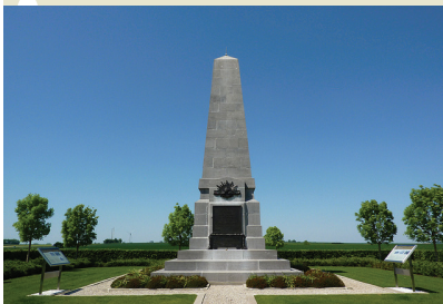
Le monument australien de Bellenglise