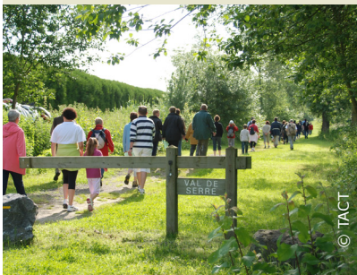
Randonneurs sur le Val de Serre