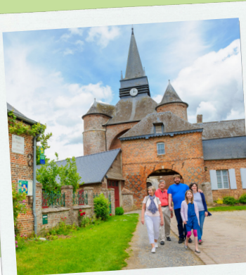
Promenade dans Parfondeval

Bienvenue à Parfondeval, figurant parmi les Plus Beaux Villages de France ! Empruntez le circuit d'interprétation et découvrez un cadre paisible et préservé, ponctué de points de vue uniques sur le bocage et l'habitat typique de Thiérache. Avant la balade, nous vous invitons à vous rendre au point d'accueil touristique du Relais de la Chouette (information, restauration, services). Renseignements : tél. 03 75 10 00 15. Circuit Le chemin de la Brique et du Torchis téléchargeable sur www.randonner.fr . D'autres renseignements touristiques sur www.tourisme-thierache.fr .