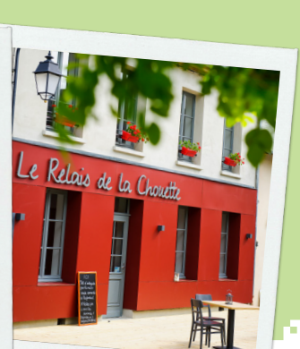
Le Relais de la Chouette