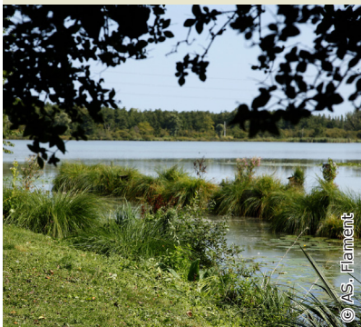
Etang de Bihécourt