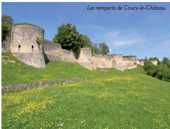
Les remparts de Coucy-le-Château.

Au carrefour de l'Oise et de multiples canaux, Chauny a vécu une histoire bien tourmentée. De belles bâtisses Art déco témoignent de sa reconstruction dans les années 1920 et 1930. Un circuit pour découvrir Chauny et la campagne environnante.