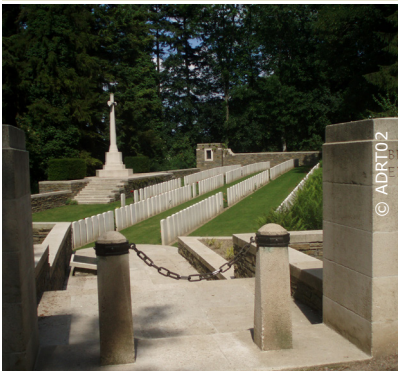
Cimetière britannique de Caulaincourt

L'Omignon musarde entre Trefcon et Caulaincourt, avec son cortège d'étangs et de bois. Après les ruines de l'église Saint-Martin-des-Prés (voir les pierres tombales dans le cimetière), ce circuit tranquille et ombragé rejoint l'étang de Caulaincourt.