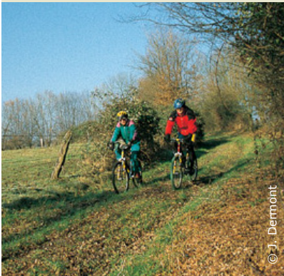
Le Corbion, sur la première partie du circuit.

INFOS TOURISTIQUES : Office de tourisme du Pays de Thiérache Tél. : 03 23 91 30 10