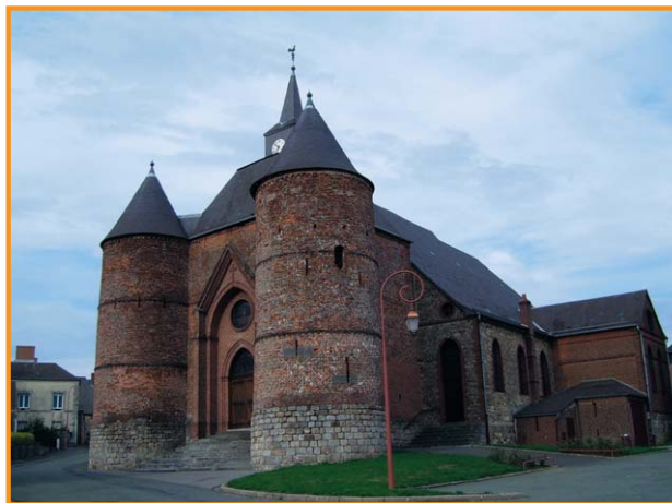
Église fortifiée de Wimpy. -Syndicat Mixte Pays de Thiérache-

D Après avoir visité l'église fortifiée, s'attarder quelques instants devant l'édifice pour admirer l'un des donjons les plus importants de Thiérache. Ensuite, se diriger vers la place Foch. Remarquer les belles bâtisses en brique du XIX e siècle. 1 Au bout de la place, prendre à gauche le chemin de la Fontaine. Franchir la passerelle pour apercevoir le lavoir et l'ancien moulin (non visitable) sur la droite. 2 Monter le chemin pour aboutir dans la rue H.-Duvilliers. 3 Tourner à gauche (prudence ▲). 4 Ne pas rejoindre le carrefour mais s'engager un peu avant sur le sentier bordé de haies sur la gauche, afin de rejoindre l'abreuvoir puis la rue de la Briqueterie.