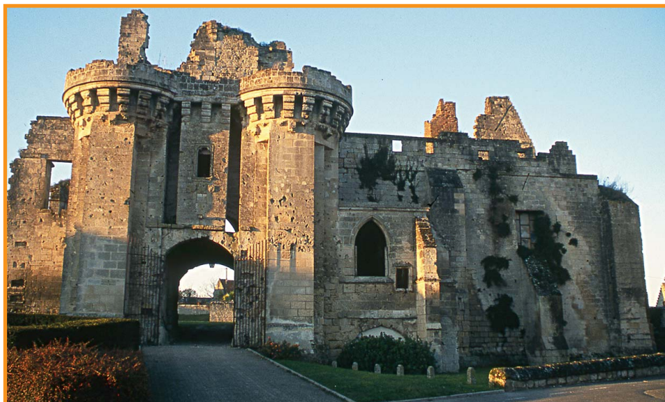
Le château de Berzy-le-Sec. -F.X.Dessierier-

Au départ du centre historique de Soissons, cet itinéraire fait la part belle à l'art et à l'histoire autant qu'aux paysages très variés qu'il traverse : la vallée de l'Aisne avec son trafic fluvial, vue du chemin de halage, les monts environnants ponctués de panoramas sur Soissons et la vallée de la Crise puis, village après village, des châteaux, des églises et des sites fortifiés qui ont pour nom Septmonts, Berzy-le-Sec, Noyant-et-Aconin, Vauxbuin... Bienvenue sur ce sentier du Sud soissonnais, qui vous aidera à dévider l'écheveau de deux mille ans d'histoire et d'occupation humaines.