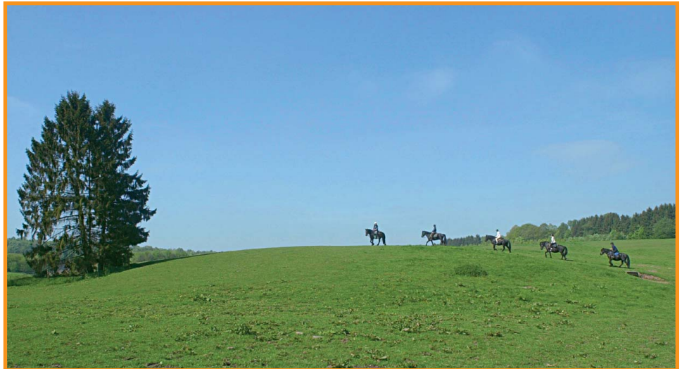
Paysage à proximité de la ferme de la Neuve Forge. -S. Lefebvre-

Les beaux étangs d'Anor (La Neuve-Forge, Milour, le Pas-Bayard...) furent créés aux XV e et XVI e siècles pour alimenter les forges locales, qui utilisaient la force hydraulique ainsi obtenue. Aujourd'hui, ces étendues d'eau calme profitent aux pêcheurs comme aux promeneurs.