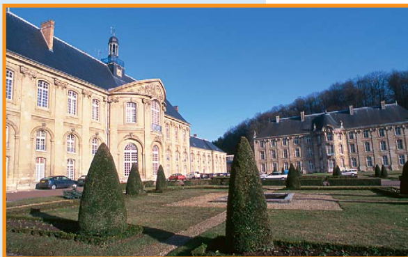
L'abbaye de Prémontré, au cœur de la forêt. -S. Lefebvre-