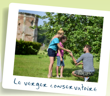
Le verger conservatoire