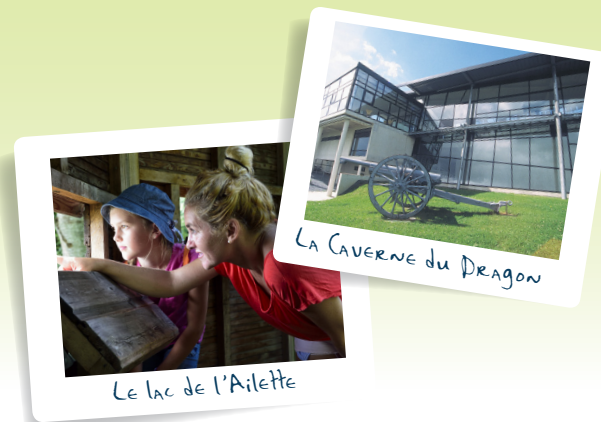
LA CAVERNE DU DRAGON