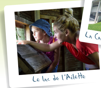
Le lac de l'Ailette