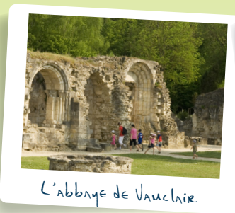
L'abbaye de Vauclair