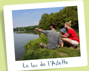
Le lac de l'Ailette

Pilonné par l'armée française durant l'offensive du général Nivelles en avril 1917, il ne fut jamais reconstruit, tout comme 5 autres villages du canton de Craonne. Un monument avec une inscription « Ici fut Ailles » marque l'emplacement de l'ancien village.