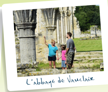
L'abbaye de Vauclair