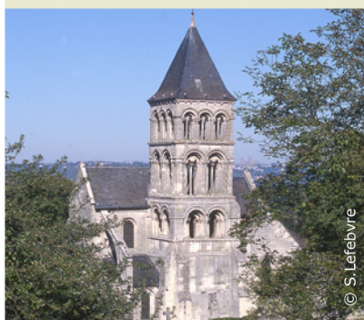
L'église classée de Nouvion-le-Vieux